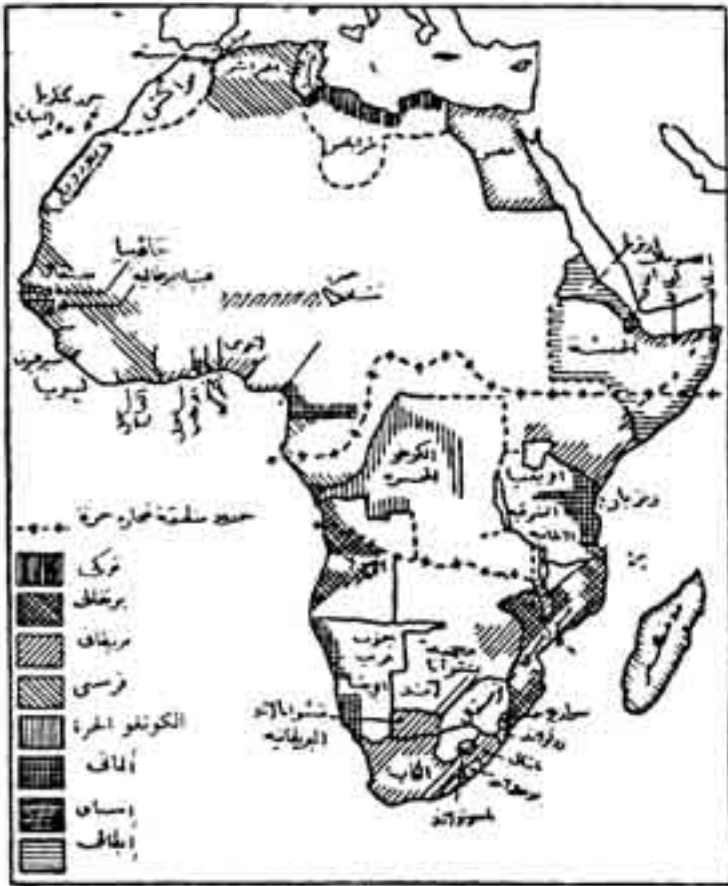
أفريقيا في ١٨٩١

وقعت معاهدة مع فرنسا في 14 يونيو 1898 قبل الفرنسيون بمقتضاها ادعاءات بريطانيا في دولة سوكوتو. وبعد عامين تولت الحكومة الإشراف على نيجيريا الشمالية، وهذا يعني الدخول في صراع مع الدولة الإسلامية في سوكوتو، وهو الصراع الذي استمر ثلاث سنوات متصلة من الكفاح والنضال الإسلامي المشرف ضد القوى الأوروبية حتى سقطت دولة سوكوتو في عام 1903 (25) .