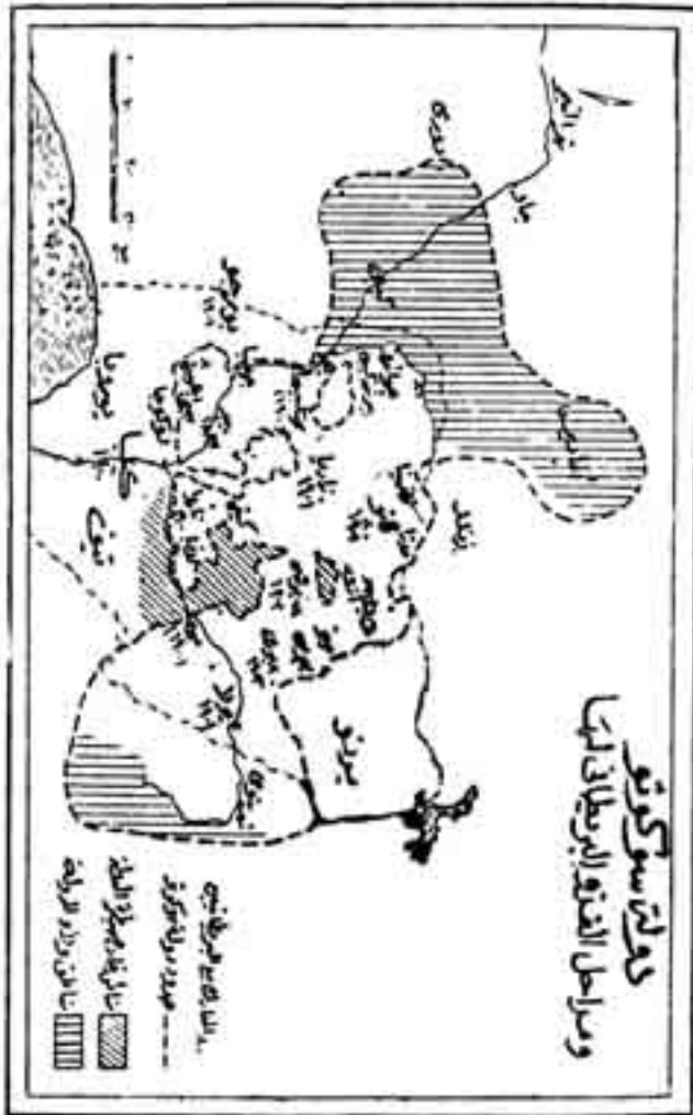
الشكل رقم (5)

الذهاب إلى سوكونتو بالجزية السنوية من المرور في أرضه. كل هذه الأسباب أعطت مبررا للبريطانيين لغزو إمارة زاريا الإسلامية هذا في الوقت الذي أتاحت الإمارة ذاتها الفرصة للبريطانيين عندما استجبت بهم للقضاء على أمير كونتاجورا الذي كان يغير على قرى الإمارة.