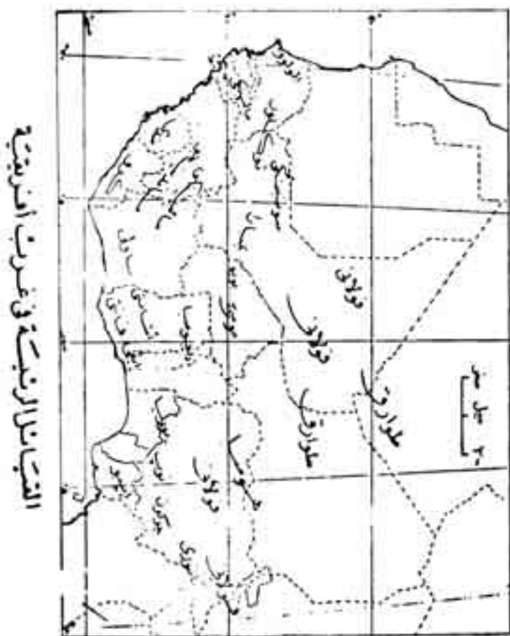
شكل رقم (14)