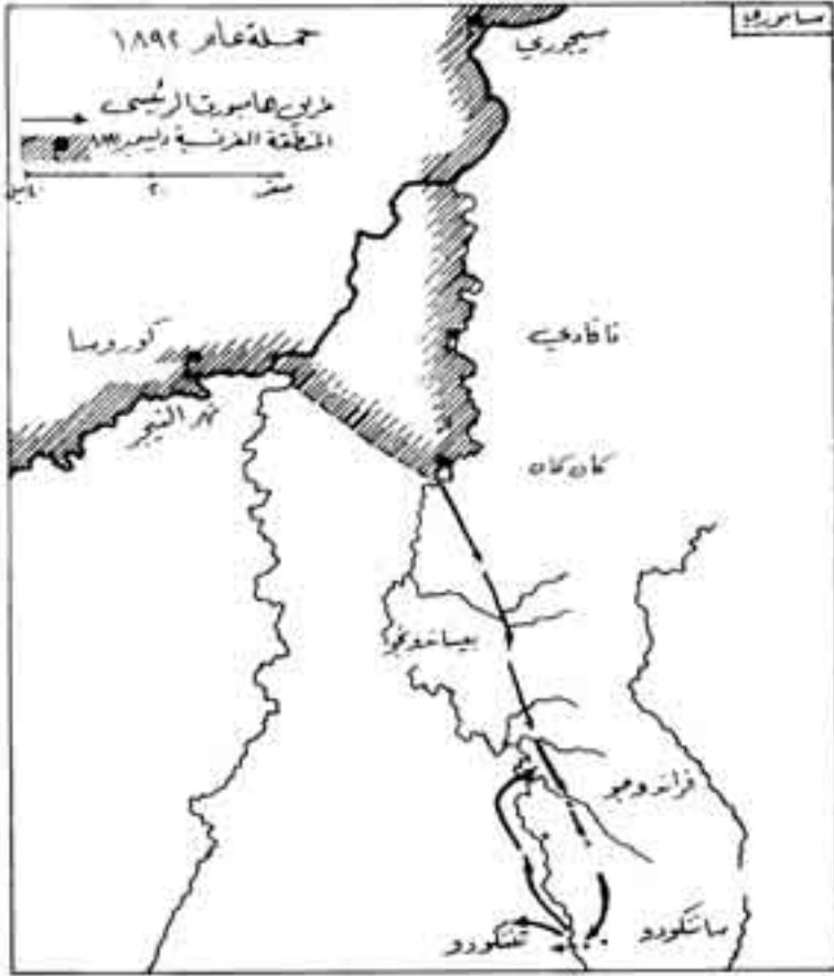
شكل رقم (١١)

الذين يكونون له كل عدا، فقرر الابتعاد عن سيطرة الأوروبيين حتى يعيد تشكيل قواته، ويضيف إليها دماء جديدة قادرة على مواجهة هذا الحشد الضخم من الفرنسيين (2).