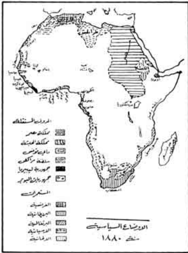
الشكل رقم (١)