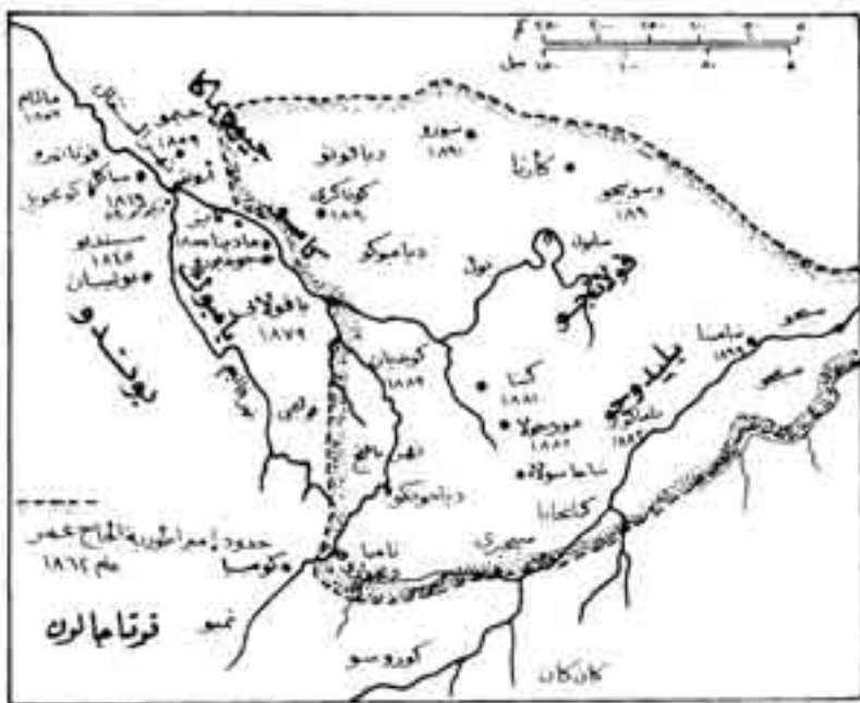
شكل رقم (6)

غزو ماسينا بسبب المجاعة، لكنه عاد وارتفع إلى 30000 جندي عام 1861. وفي عام 1852 أعلن الحاج عمر الجهاد ضد الوثنيين في السودان الغربي، واستطاع في خلال عشر سنوات أن يسيطر على كل السودان الغربي من حدود مدينة تمبكت حتى حدود السنغال الفرنسية، ورغم أنه اعتبر نفسه مصلحاً دينياً، وأعلن الزهد في الأمور الدنيوية المؤقتة إلا أنه كان مستعداً لتحقيق آماله من خلال الطرائق السياسية والعسكرية. واعتبر الحاج عمر أن رسالته المقدسة هي تنقية الإسلام في السودان الغربي من كل ما علق به من شوائب، ووضع حد للوثنية، وتطبيق الشريعة الإسلامية. ومن هنا وضع نفسه على رأس دولة إسلامية. واتبع أسلوب العنف في تحويل الناس الوثنيين إلى الشريعة الإسلامية. وقام ببناء المساجد ونشر المدارس القرآنية في كل أرجاء المنطقة التي امتدت إليهما حركته الإصلاحية. (1)