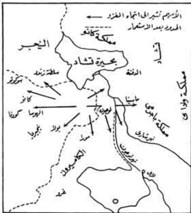
شكل رقم (12)

مربع، وتضم أكثر من خمسة ملايين نسمة (3) .