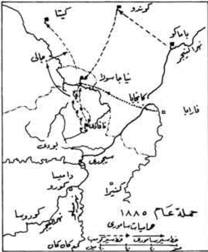
شكل رقم (١٠)