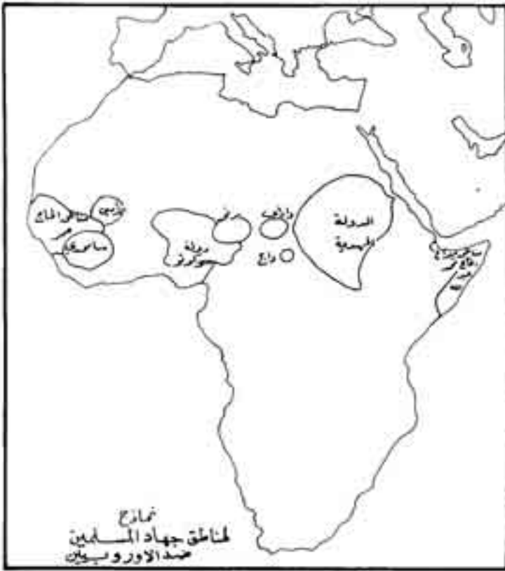
شكل رقم (14)