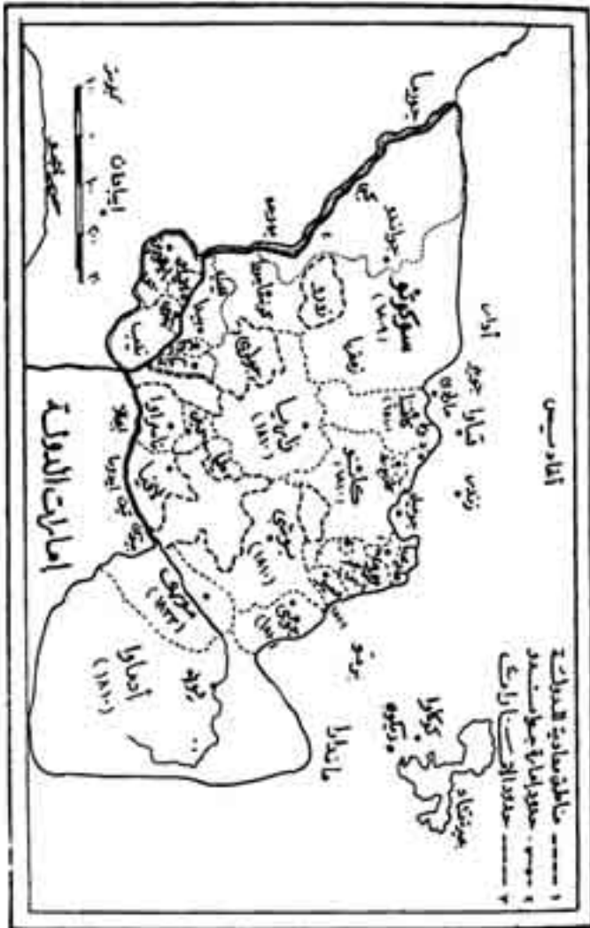
الشكل رقم (3)