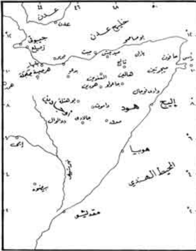
شكل رقم (13)

الصوماليين يقدر بحوالي خمسمائة فارس بقيادة موسى فارح من هود . وأما قوات المجاهدين فقد تركزت في إقليم بارن وتقدر بحوالي ثلاثة آلاف مقاتل، واتجهت هذه القوة قبل الاشتباكات نحو الجنوب، ووصل سواين إلى بوهوتلي، وأقام بعض الحصون هناك لحماية آبار المياه ومخازن التموين، واستقر أخيرا في أريجو شمال منطقة مدق (2) (Mudug). وفي 20 يولييه عام 1902 بدأت القوات البريطانية هجومها على جيروى (Gherouey) بهدف تطهير ساحل الصومال من الدراويش، ومع نهاية أغسطس وصلت القوات البريطانية إلى جاعولو (3) (Gaolo).