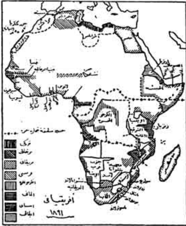
الشكل رقم (4)

سقوط هذه الخلافة في أيدي البريطانيين في عام ١٩٠٣ (١).