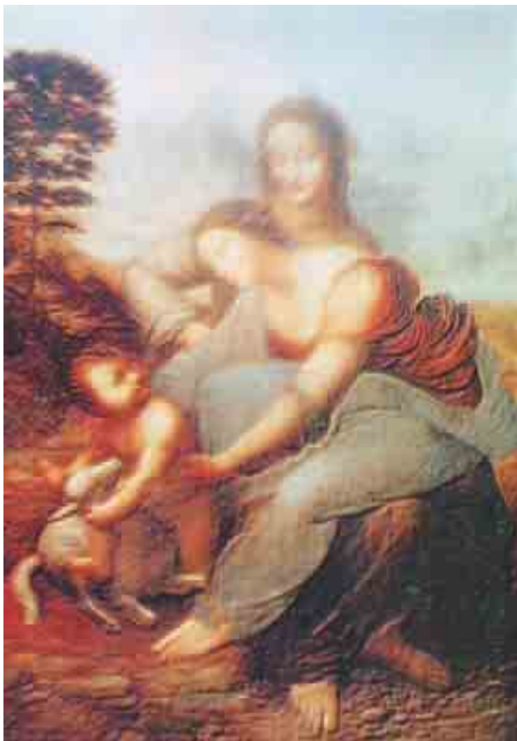
تفصيل من لوحة: القديسة آن والعذراء والطفل