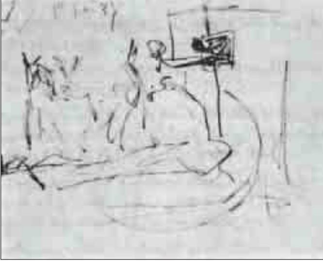
دراسة لأول تكوين للجورنيكا (أول مايو 1937)

عن حالة الفنان، ولكنها معبرة بشكل أكبر عن حال العالم.» ويقوم أرنيهم بعد هذا بتقديم الاسكتشات والصور التي استطاع أن يحصل عليها لمراحل عملية رسم الجورنيكا، ويحاول دراسة ما ورد في كل منها مركزا على ما يأتي: