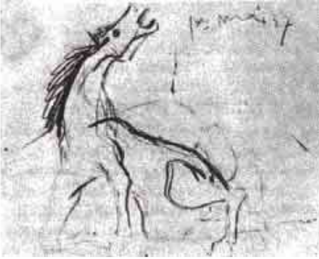
دراسة للحصان فى لوحة «الجورنيكا» (أول مايو 1937)

بعينه الزائغتين، وفتحتي منخاره المتسعتين، ولسانه الذي يشبه رأس خنجر مدبب داخل شذقيه الفافرين، ويقوم كل هذا كنقيض لأرضية سوداء تماما مرسومة بالزيت.