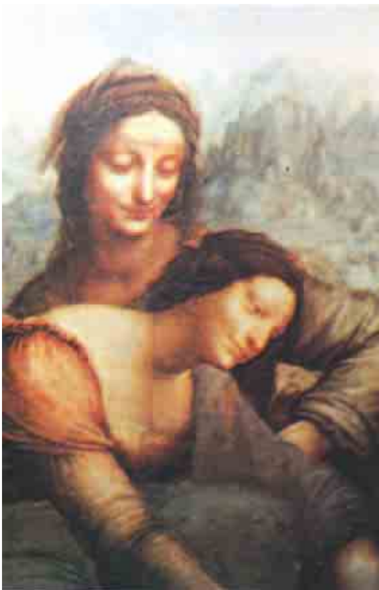
القديسة آن والعذراء والطفل