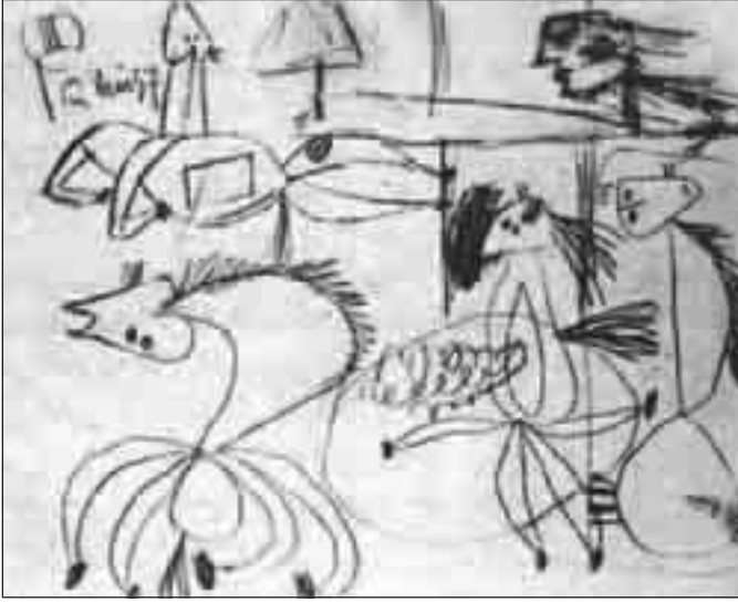
الدراسة الثالثة لتكوين الجورنيكا (أول مايو 1937)

الفنان إلى تصميم لا يمكن وصفه من خلال عملية التخصيب أو الإثراء المتتالي للأجزاء أو القطع ولكنه يتميز بأنه نمو دياكتيكي يتم بتبادل النظر إلى الجزء وإلى الكل في عملية تقدم وتأخر بينهما. وهنا ينبغي علينا ألا نتأمل مجرد الحركة المناسبة للصورة ككل، بل علينا كذلك أن نحصر العلاقة بين الصورة وبين جزئياتها في مختلف المراحل. إن العمل الفني لا يتقدم إلى الأمام على نحو ما يحدث للبذرة أو الكائن الحي، ولكنه ينمو على نحو ما يحدث في حركة التآرجح للأمام وللخلف من الكل للجزء ومن الجزء للكل وهكذا في حركة دياكتيكية مستمرة في التقدم والصعود.