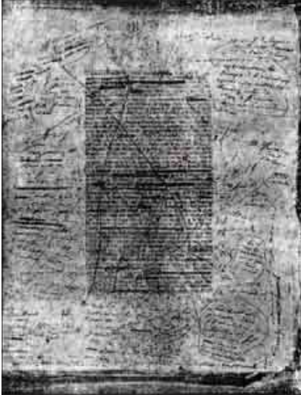
تجربة صفحة من مخطوط بلزك وأهداها إلى النحات دافيد دانجيه مذيلة بهذه العبارة: «ليس النحت مقصورا على النحات»

ديسمبر من عام 1935. ويهمنا في هذا السياق أن نعرض لما يقوله عن لحظة الإلهام (*) ، وما سبقها من جهد شديد في مرحل الإعداد التي تميزت بعدم رضائه عما كتب وتمزيقه له عدة مرات. ثم وصل أخيرا بعد فترة من الكمون إلى المرحلة الأخيرة من عملية الإبداع التي، يصفها بأسلوبه الرائع فيقول: «.. ومر نحو أسبوع وأنا لا أجد إلى هدوء نفسي منفذا» وأخذت ديوان أبى الطيب (المتبى) مرة خامسة أقرؤه لا أتوقف ولا أمل ولا أهدأ.